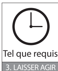
3. LAISSER AGIR